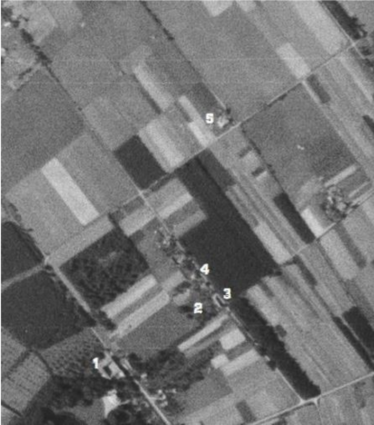
(luchtfoto V.S. Casey Jones nr. 537 genomen op 14 juli 1945. )

Duidelijk te zien en in tegenstelling tot nu, nauwelijks enige bebouwing .