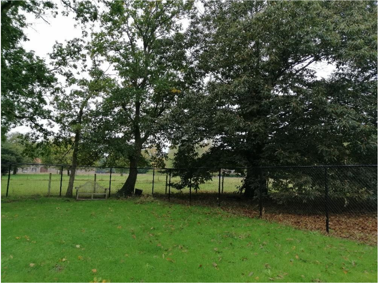
(kastanjeboom waar de veldgraven waren met op de achtergrond de Kiewithoeve)