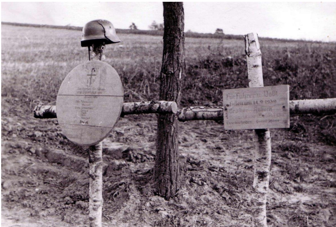
(Voorbeeld van 2 veldgraven van Duitsers met berkenhouten kruisjes)

De burgemeester vraagt om de bevoegde instanties hiervan kennis te geven met het oog op de ontgraving van deze oorlogsslachtoffers.