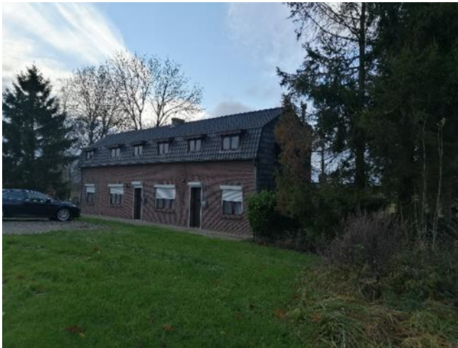
(Woning langs de Zuid-Willemsvaart waar links daarvan een bom viel.)

Het is niet omdat de bezetting gedaan was dat de miserie voorbij was. De brug aan de sluis te Neerharen was nu een doel dat de Duitsers graag vernietigd hadden gezien en bijgevolg werden er regelmatig aanvallen uitgevoerd door de luchtwaffe. Bij een aanval in de nacht van 31 december 1944 op 01 januari 1945 trof een bom niet de brug maar wel de woning van het gezin Pelsers-Libert zo'n 2 km verder gelegen langs het kanaal te Rekem waarbij er 2 dodelijke slachtoffers te betreuren vielen.