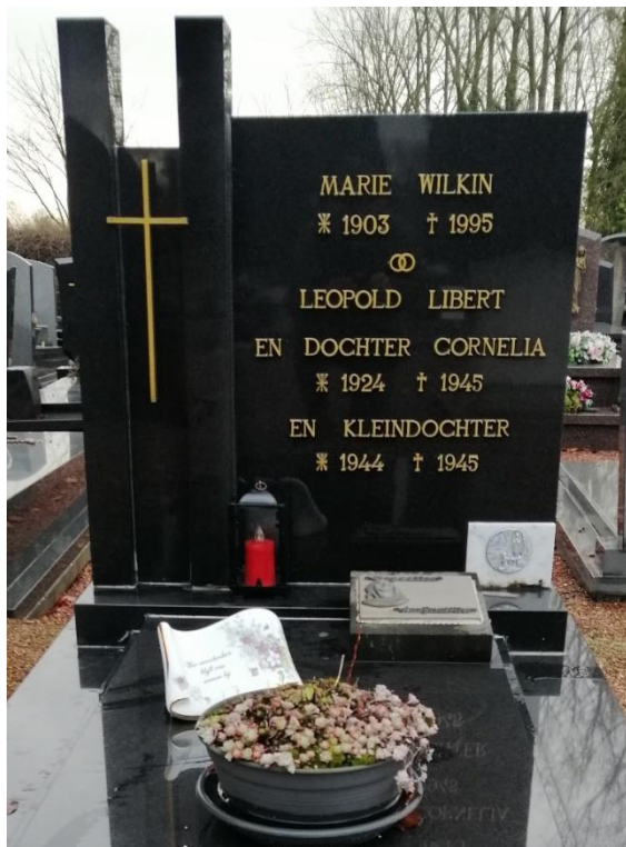
(Begraafplaats te Rekem)