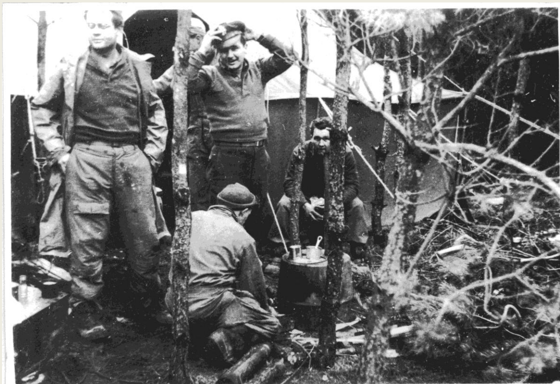
Foto: Het leven in primitieve omstandigheden op Y-29