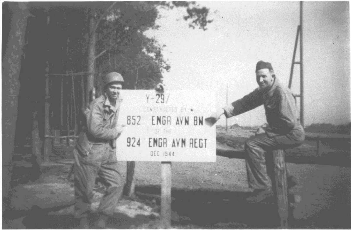
Foto: Engineers van de 9 th USAAF poseren bij het bord aan de toegang van Y-29 (ergens in de buurt van de Leutsestraat?)

In november 1944 begonnen Engineers van de 9 th USAAF (852 nd en 846 th Engineer Aviation Battalions) met de constructie van Advanced Landing Ground Y-29. Het vliegveld bestond uit één enkele start- en landingsbaan van 1500 meter die aangelegd werd met PSP platen. De richting van de startbaan was 06/24. Daarnaast werden tenten opgericht om de manschappen in onder te brengen en voor ondersteuningsdiensten. Er werd een toegangsweg aangelegd die min of meer de bestaande wegeninfrastructuur volgde. Er werd een opslagplaats gebouwd voor goederen, munitie, benzine en drinkbaar water. Er werd een minimum aan electriciteitsleidingen gelegd en ook telefoonleidingen en verlichting werd voorzien.