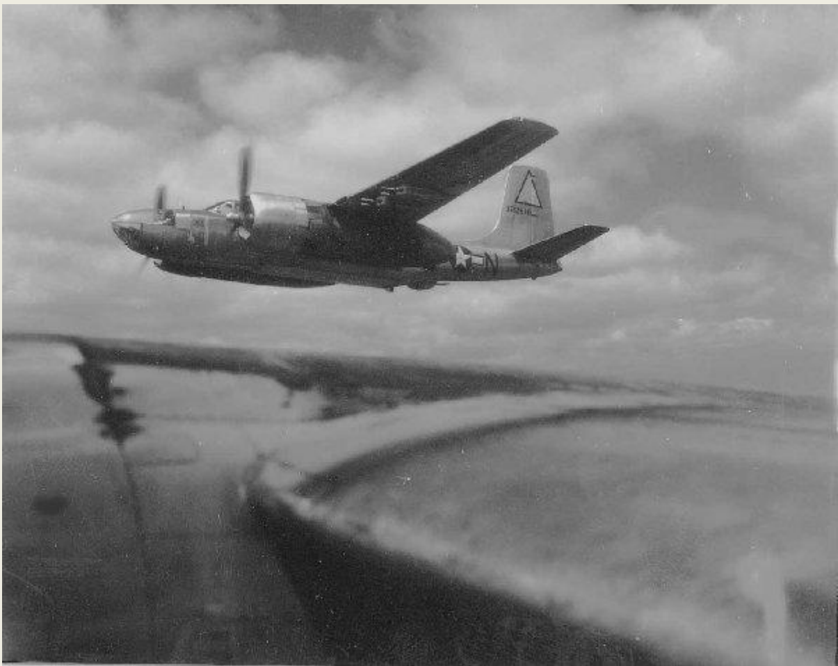
Foto: A-26 Invader van de 391st Bombardment Group