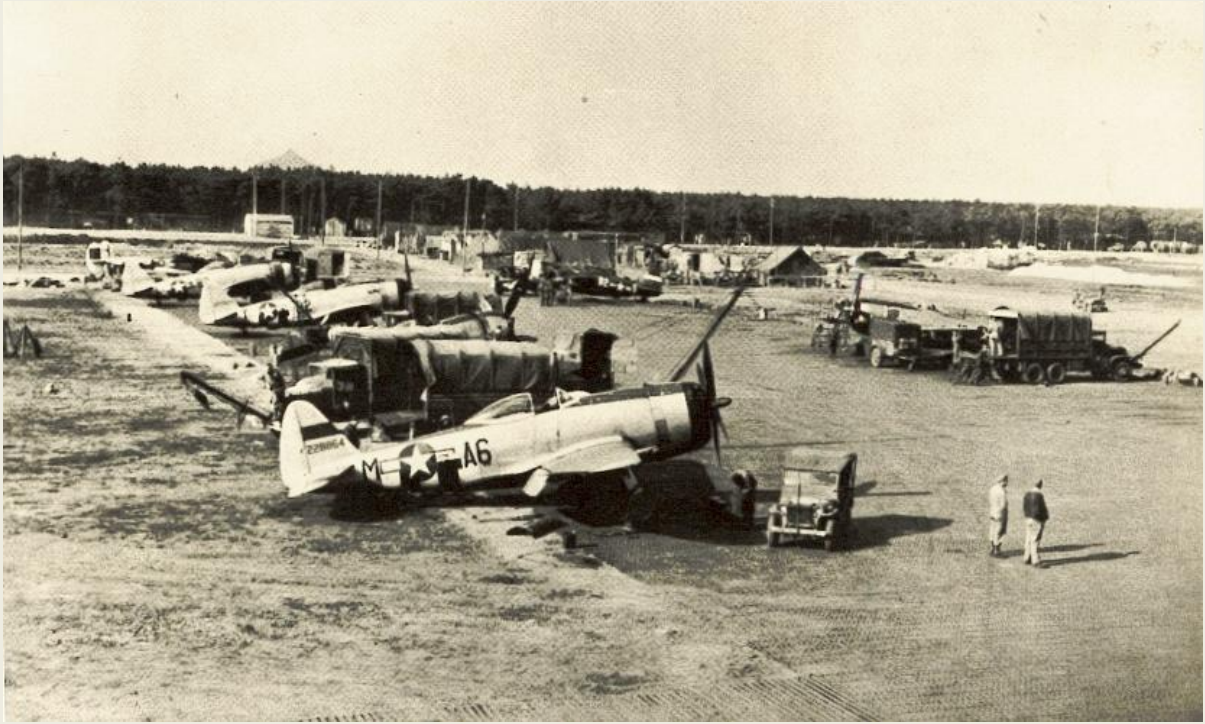
Foto: P-47D Thunderbolts van de 366th Fighter Group op Y-29