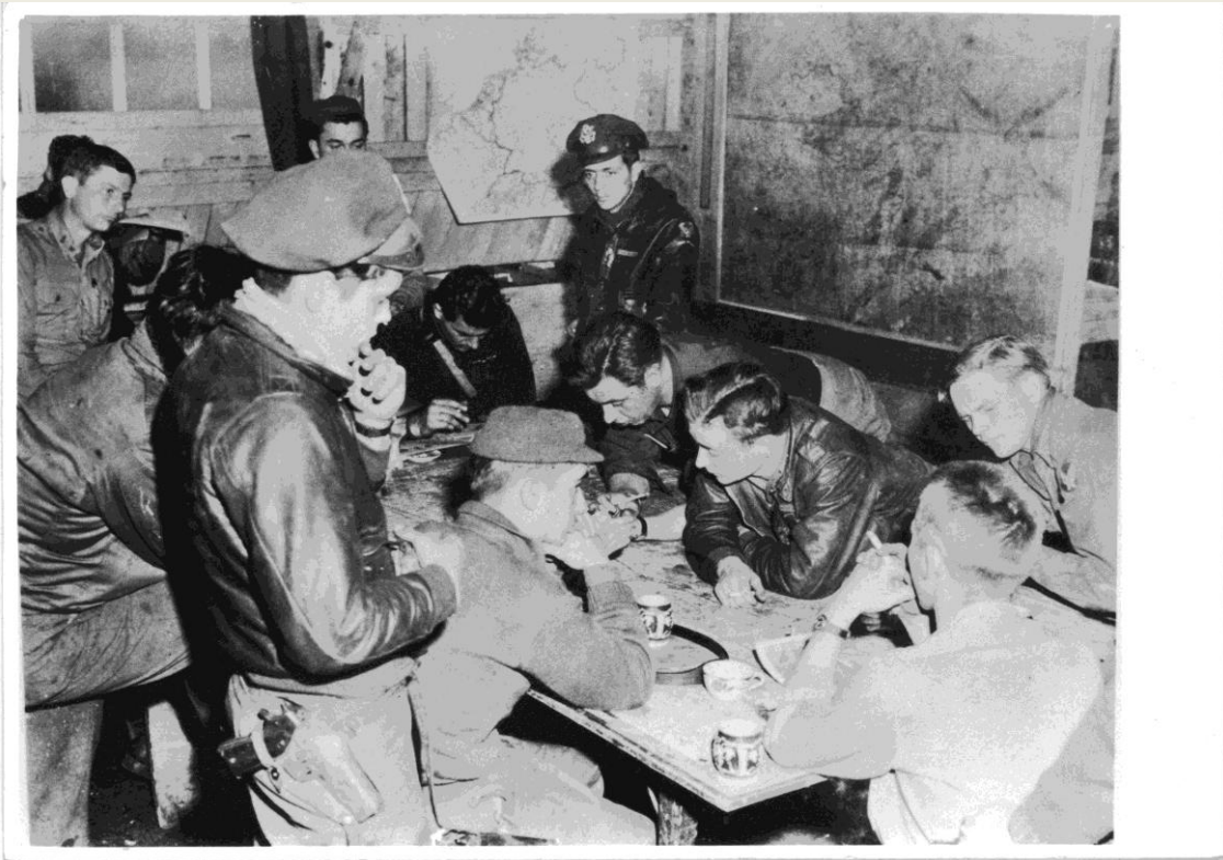
Foto: Piloten tijdens de briefing met kaarten van de regio op de achtergrond. De foto is vermoedelijk genomen tijdens het Ardennenoffensief omdat ze zelfs tijdens de briefing bewapend zijn. Men verwachtte vijandelijke aanvallen van parachutisten of zogenaamd Skorzeny commando's.