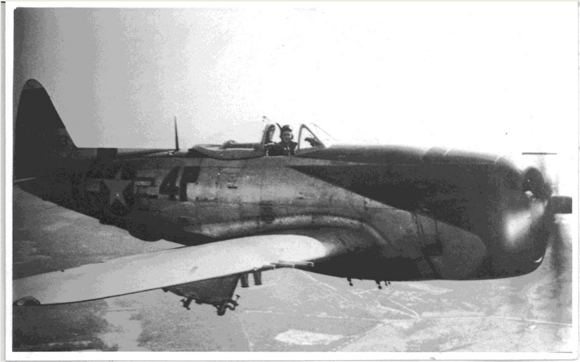
Foto: P-47D Thunderbolt van het 513th FS