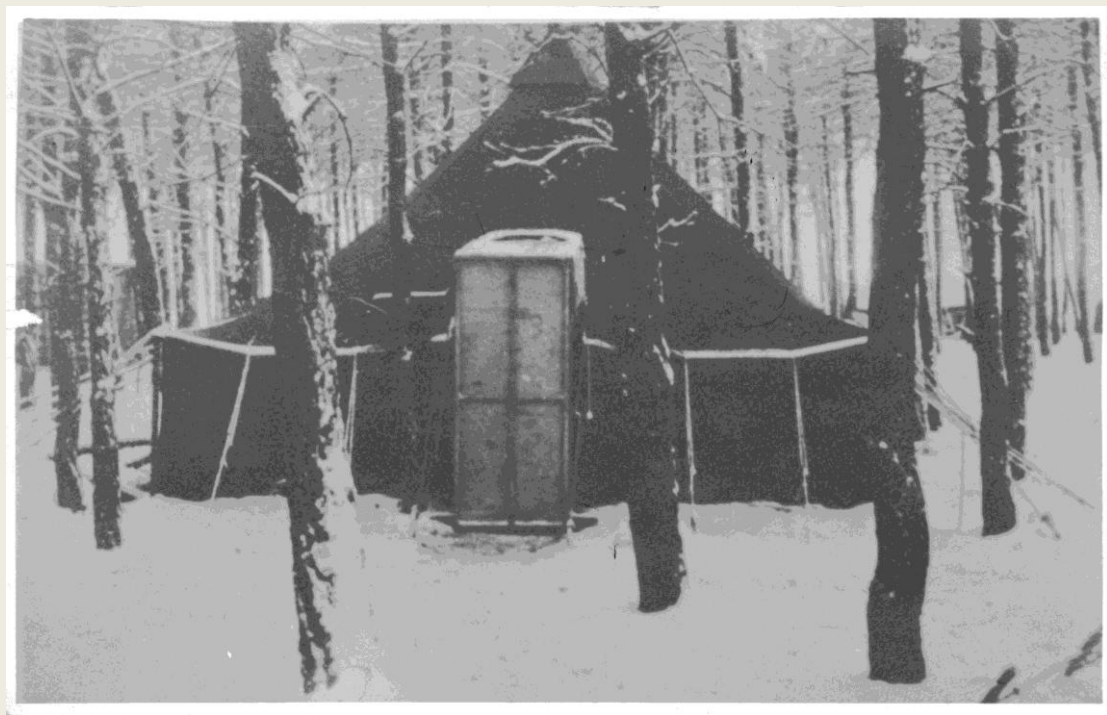
Foto: Een van de tenten gebruikt voor de huisvesting van de manschappen in de winter van 1944-1945.